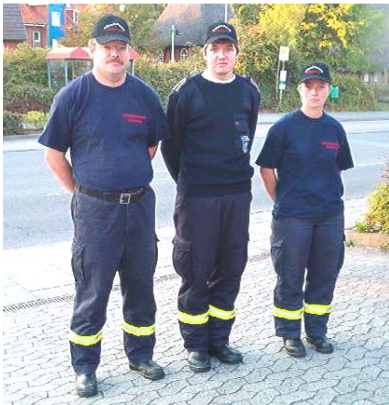
Dienstbekleidung mit T-Shirt, Pullover und Cap