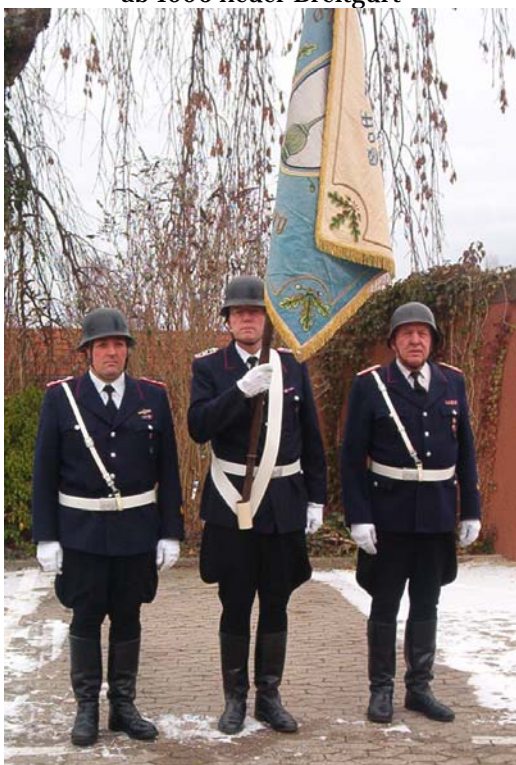
Fahnenabordnung bis 1971 Stiefelhose, schwarzer Helm