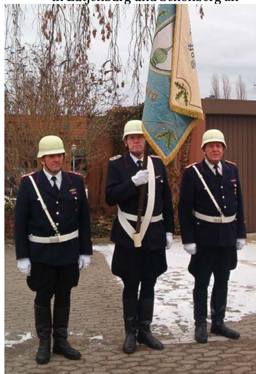
Fahnenabordnung 1971 bis 1992 Stiefelhose, gelber Helm