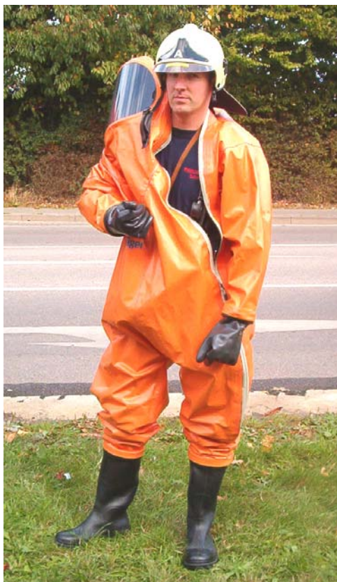
CSA-Anzug (Chemikalien) Ausrüstung des Löschzuges Gefahrgut (LZG)