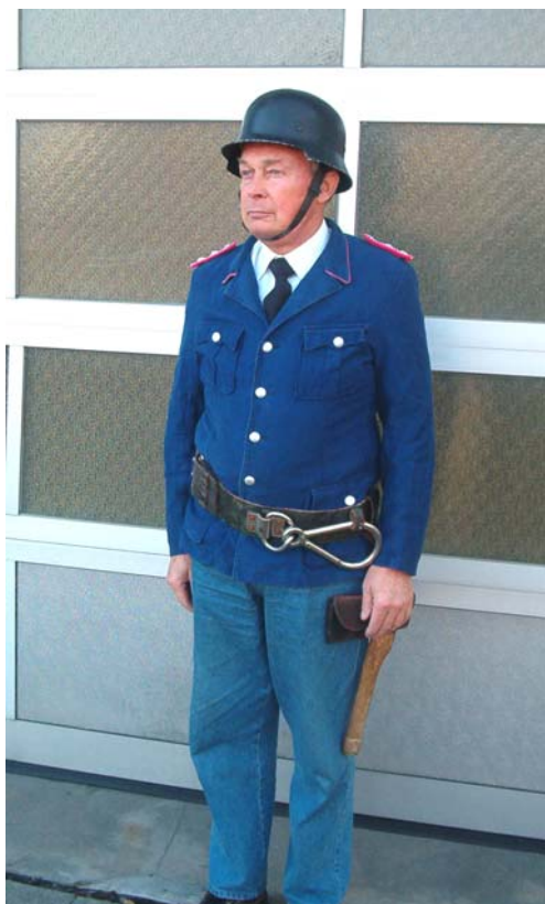
1954 bis 1969 Pilotrock und schwarzer Helm