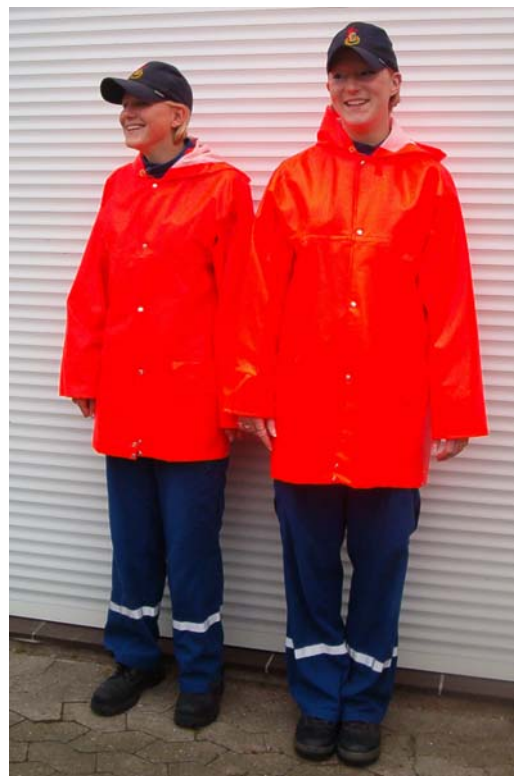
Dienstanzug mit Wetterschutzjacke