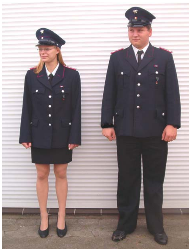
Feuerwehrfrau und Oberfeuerwehrmann