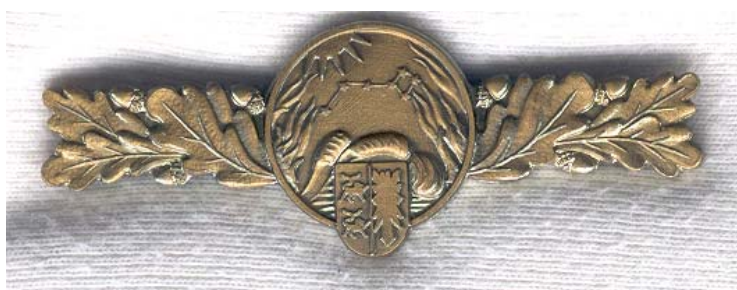
Leistungsspange in Bronze

Die Leistungsspange in Bronze und Silber der schleswig-holsteinischen Jugendfeuerwehr wird für herausragende Jugendarbeit als Jugendwart auf Orts-, Kreis- und Landesebene vergeben.