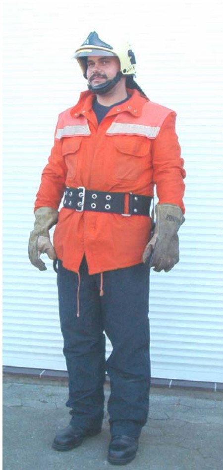
1993 bis 1999 rote Jacke, Latzhose, Dräger Helm ab 1996 neuer Breitgurt