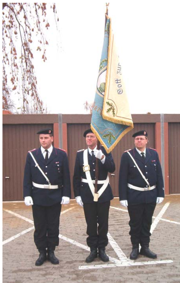
Fahnenabordnung mit Barrett (ab 1998)