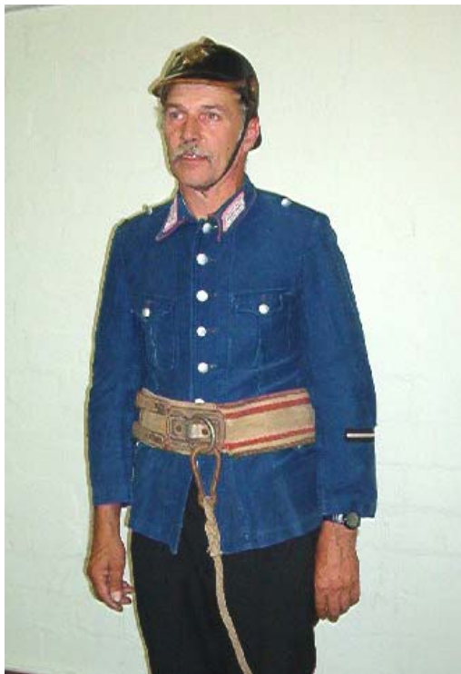
Einsatzanzug Breitgurt und Helm bis 1933