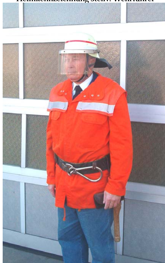
1987 bis 1993 rote Jacke, gelber Helm mit Visier