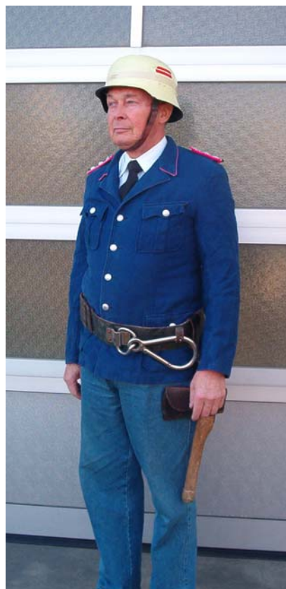
1970 bis 1977 Pilotrock und gelber Helm Helmkennzeichnung stellv. Wehrführer