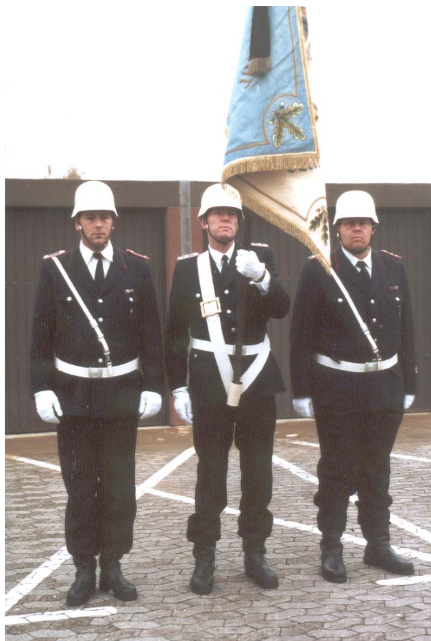
Fahnenabordnung mit Helm (ab 1992)