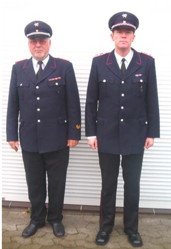
Hauptbrandmeister und Oberlöschmeister