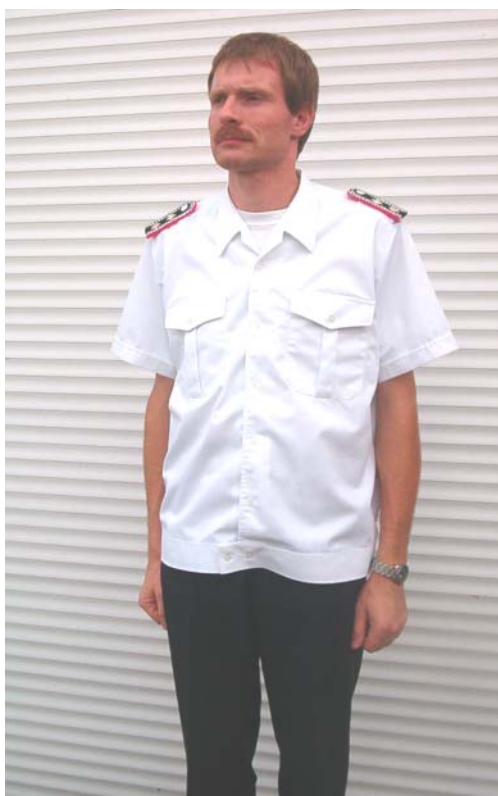
Sommerbekleidung seit 1993