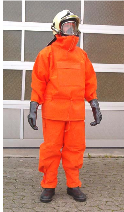
Overgame des Katastrophenschutzes