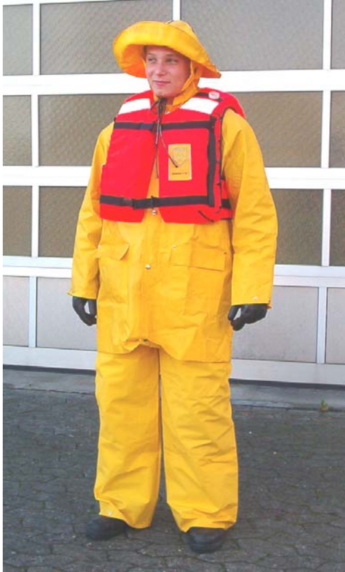
Wetterschutzkleidung mit Schwimmweste für Deicheinsatz