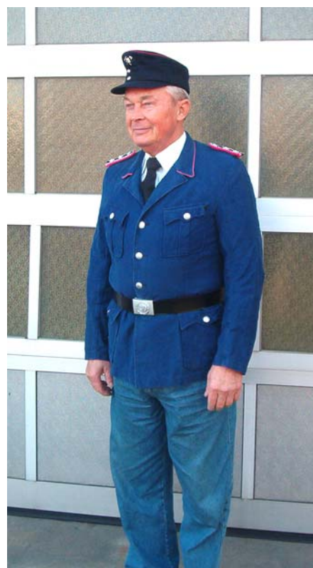
Dienstanzug 1954 bis 1981 (mit Schmalgurt, später ohne Schmalgurt)