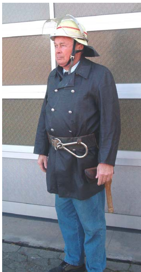
1977 bis 1986 schwarzer Wetterschutzmantel Helmkennzeichnung Wehrführer