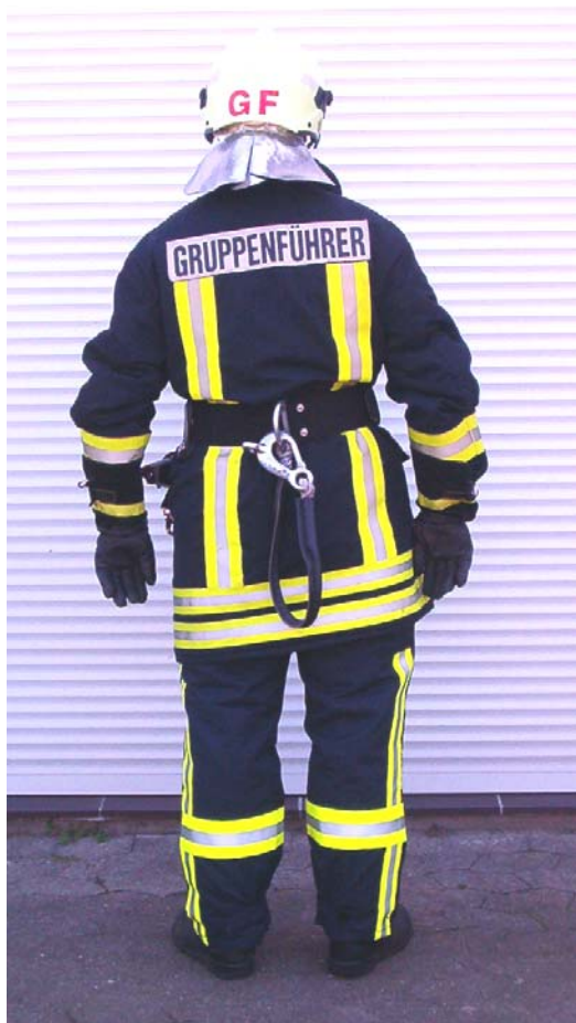
Helm- und Rückenkennzeichnung Gruppenführer