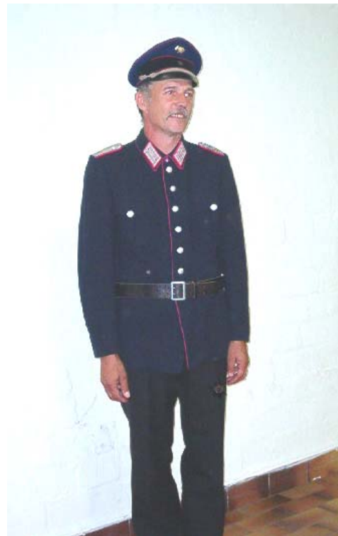
Ausgehuniform von 1945 bis 1954 Brandmeister