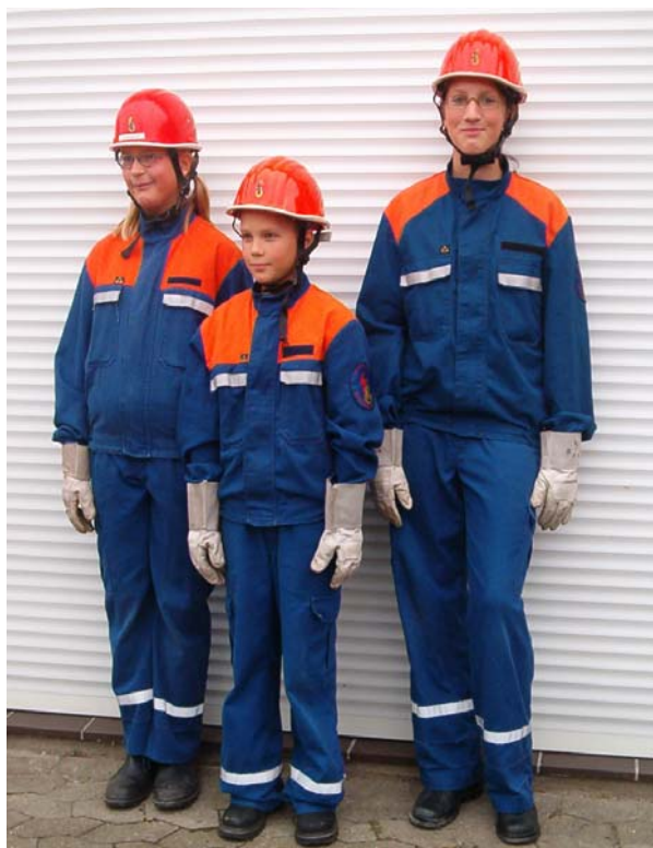
Dienstanzug mit Helm