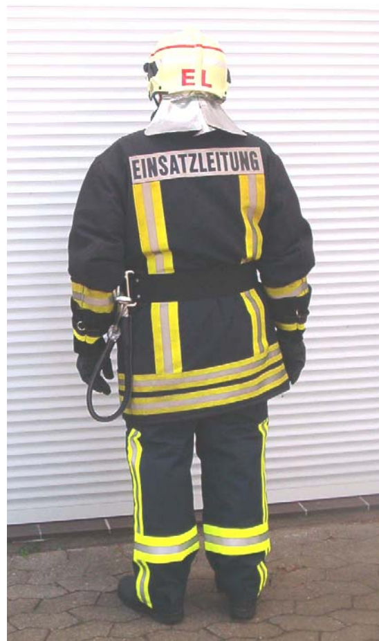
Helm- und Rückenkennzeichnung Einsatzleiter