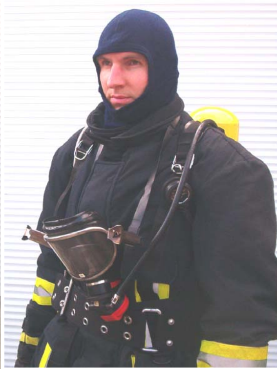
Atemschutzträger mit Kopfschutzhaube